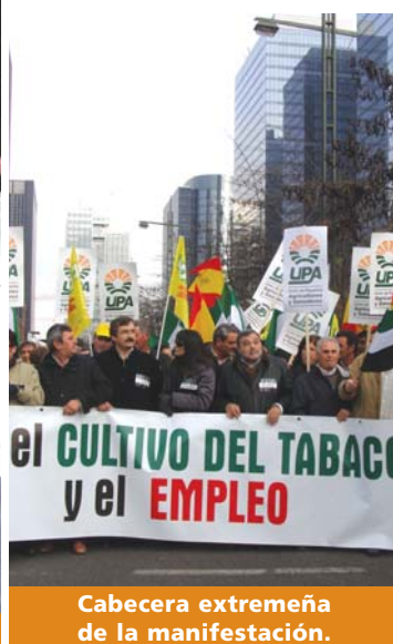
Cabecera extremeña de la manifestación.