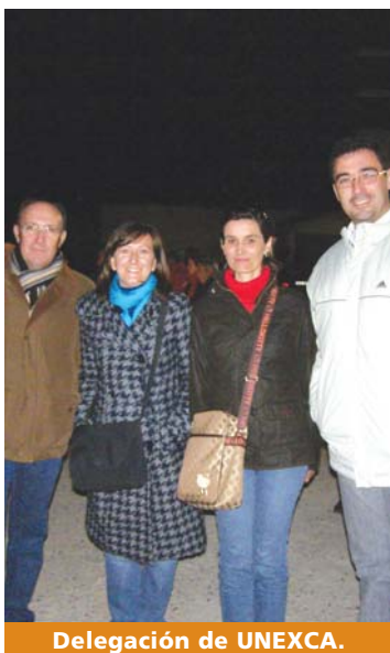
Delegación de UNEXCA.

Plaza Schuman. 13,00 horas. Tras varios kilómetros de recorrido, la manifestación concluye frente a la sede del Consejo Europeo, donde se reúnen los 27. La esperanza continúa: los diputados del Parlamento Europeo deciden apoyar, en pleno y con 345 votos a favor, la restitución de las ayudas a los productores de tabaco hasta la campaña de 2012. Mientras, sirenas, pitidos y voces claman en la