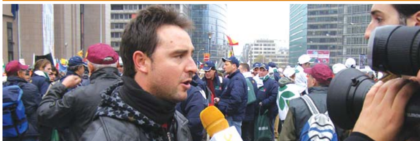
Medios extremeños realizaron el viaje junto a los tabaqueros.