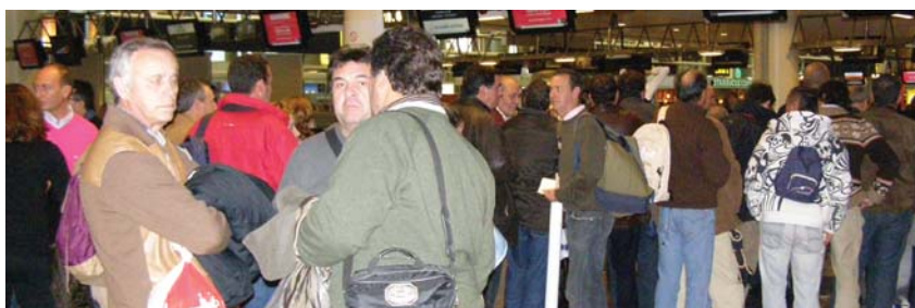
En el aeropuerto de Bruselas para regresar a Barajas.

Navalmoral de la Mata. 00,30 horas de la madrugada del jueves, 20 de noviembre. Las dudas y el "¿qué vamos a hacer ahora?" rondan la cabeza de todos, que vuelven a casa con la sensación de haber agotado el último cartucho.