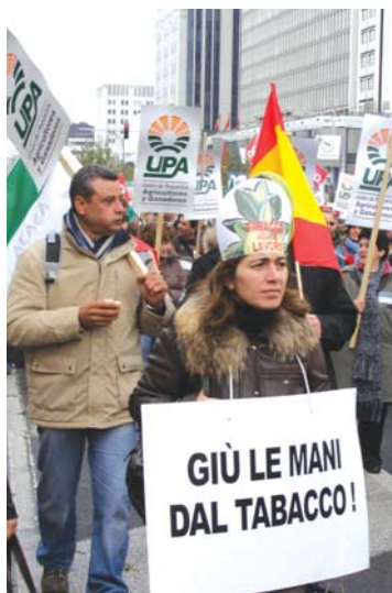
Tabaqueros extremeños e italianos.