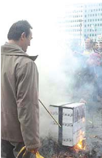
Frente al Consejo Europeo.