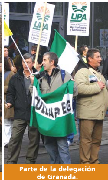
Parte de la delegación de Granada.