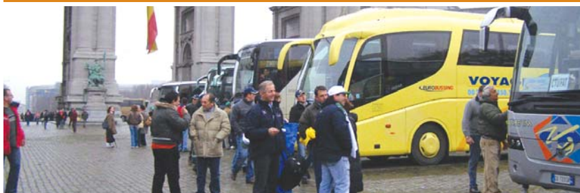
Autobuses para volver a casa.