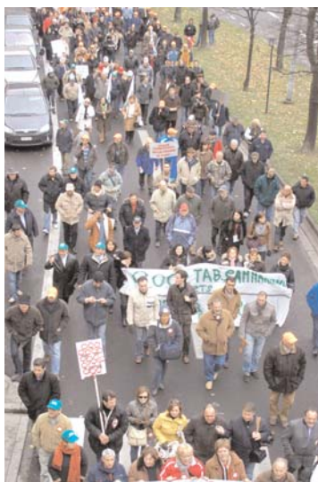
Imagen de la manifestación.