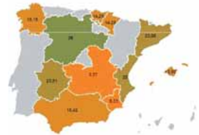
Porcentaje cooperativas de 1º (>1ME) participantes en proyectos I+D+i

La intercooperación es así una de las apuestas de las cooperativas