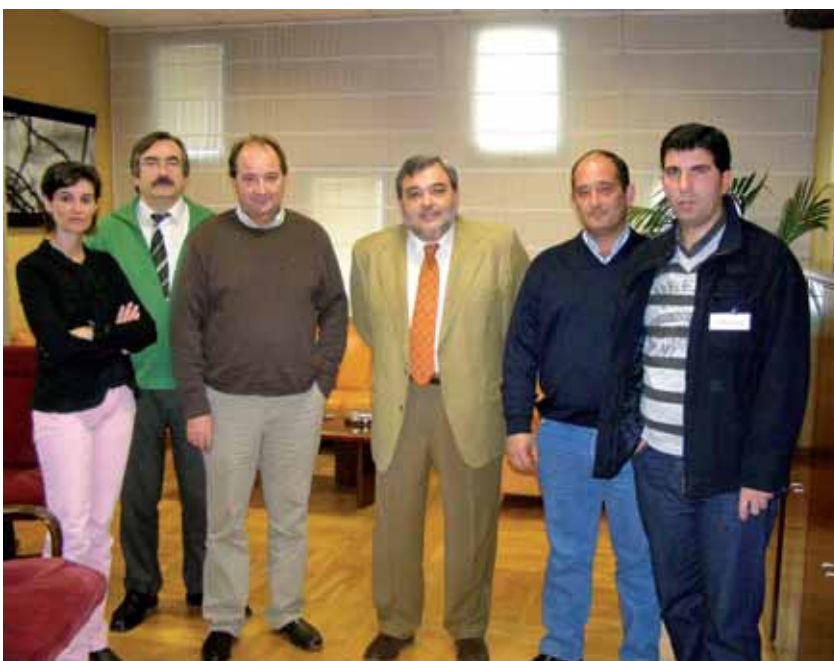
Directiva de la cooperativa tras una reunión con el consejero

Igualmente, se ha hecho una pequeña reforma en el proceso de producción de ajo deshidratado, regulando correctamente el horno deshidratador y reformando la máquina cortadora del ajo en láminas, que ha aumentado considerablemente la capacidad de producción de dicho producto, triplicando la producción del mismo.