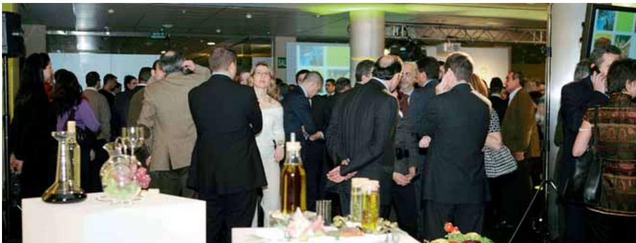
Vista general del acto de presentación, con numeroso público asistente.

Lo de cooperativas estaba claro y lo de agro-alimentarias también fue una consecuencia del Plan Estratégico de CCAE, donde se puso de manifiesto que hoy las cooperativas no se limitan únicamente a producir materias primas agrarias, sino que se han incorporado a los últimos eslabones de la cadena y están vendiendo alimentos listos para ser consumidos.