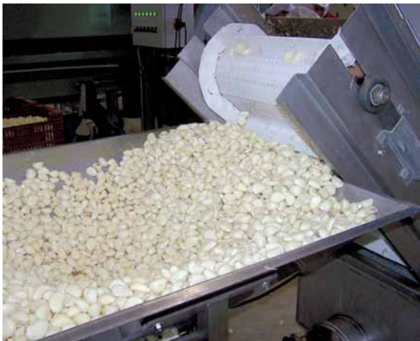
Maquinaria que se usa en la cooperativa.

Asimismo, la cooperativa Extremeña de Ajos de Aceuchal ha realizado importantes inversiones, con el objetivo de incrementar su competitividad, en todo el proceso de producción, proceso y comercialización de sus productos, que son el