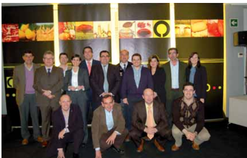
Delegación extremeña asistente al acto.

vas agroalimentarias garantizan la continuidad y la viabilidad de la actividad agraria y del empleo en el medio rural, por su propia razón de ser. Tienen un compromiso incondicional con el territorio y su gente. Estos valores las hacen diferentes de otras empresas y no son incompatibles con la eficiencia, sino que son piezas fundamentales para garantizar su mantenimiento a largo plazo, trasladando y distribuyendo el valor añadido que se genera en todo su proceso productivo, a agricultores y ganaderos y convirtiéndose así, en verdadero motor de desarrollo en el medio rural.