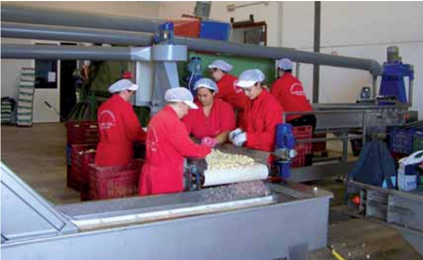
Trabajadoras de la cooperativa Extremeña de Ajos

sector, por el que la cooperativa Extremeña de Ajos de Aceuchal está apostando fuertemente.