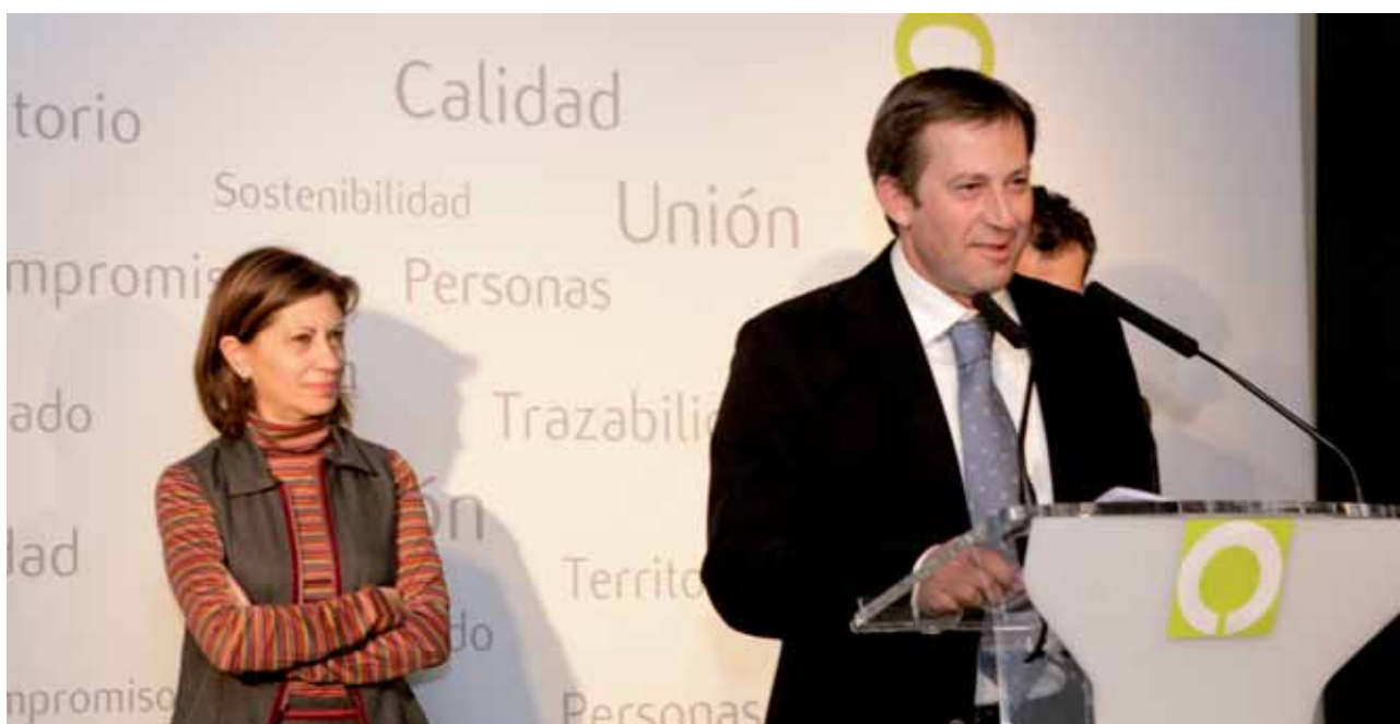
Acto de presentación de la nueva imagen.