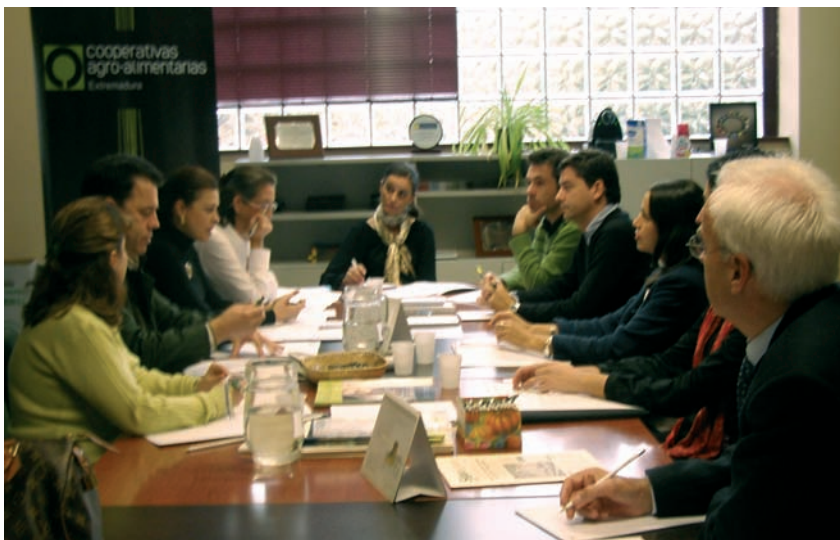
Grupo de trabajo propuesta modificación Ley Cooperativas

Esta nueva normativa posibilita que la transformación obligatoria de las aportaciones con derecho de reembolso en caso de baja en aportaciones cuyo reembolso pueda ser rehusado incondicionalmente por el Consejo Rector, o la transformación inversa, requiera el acuerdo de la Asamblea General, adoptado por la mayoría exigida para la modificación de los estatutos. El socio disconforme podrá darse de baja, calificándose ésta como justificada.